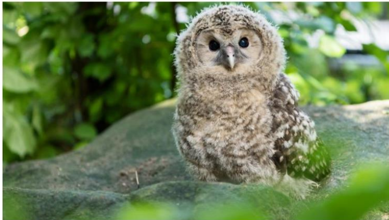
Die Habichtskäuze werden in Kürze im Lainzer Tiergarten in Wien in die freie Wildbahn entlassen.

12.06.2018 08:59 (Akt. 12.06.2018 08:59)