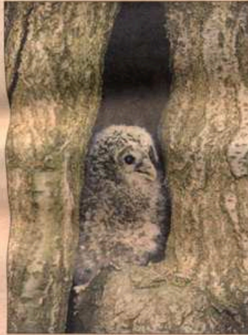
Junger Habichtskauz.

Im Rahmen eines Wiederansiedlungsprojekts wird dem in Österreich ausgestorbenen Habichtskauz, der größten Waldeule Europas, eine zweite Chance gegeben. Er soll sich in unseren Wäldern wieder ansiedeln. Dazu beitragen soll ein Arten-